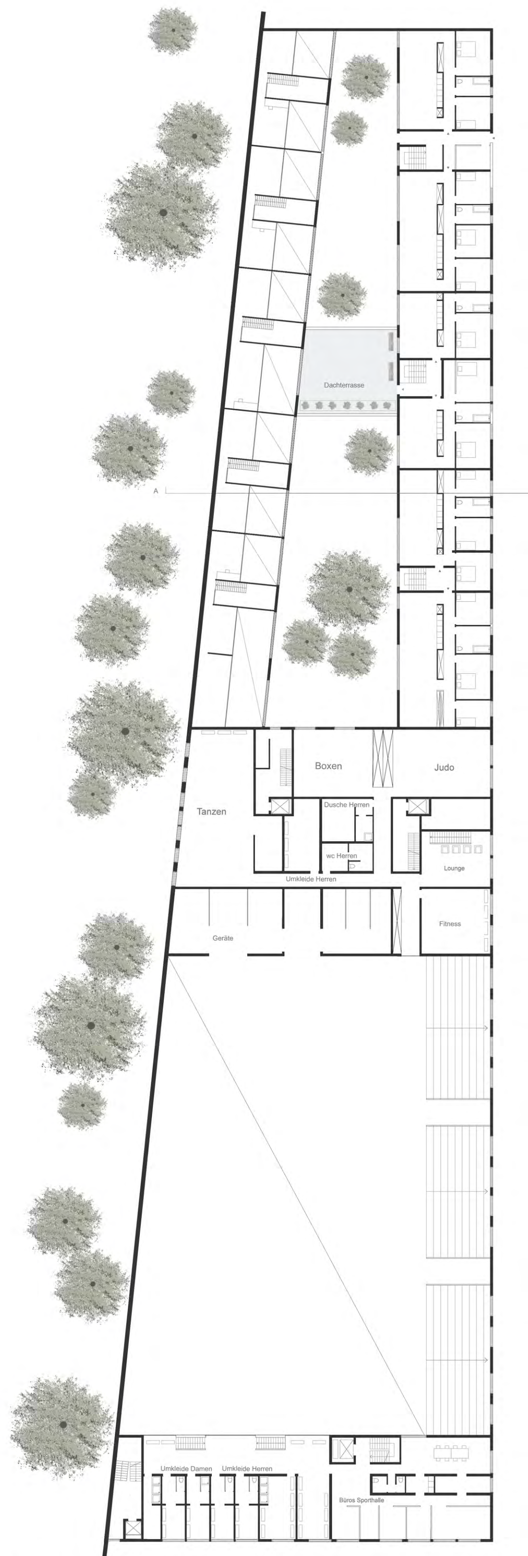
Grundriss 1. OG M 1:200