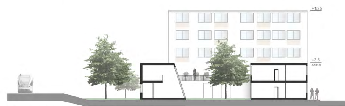
Schnitt Bebauung Bahn M 1:200