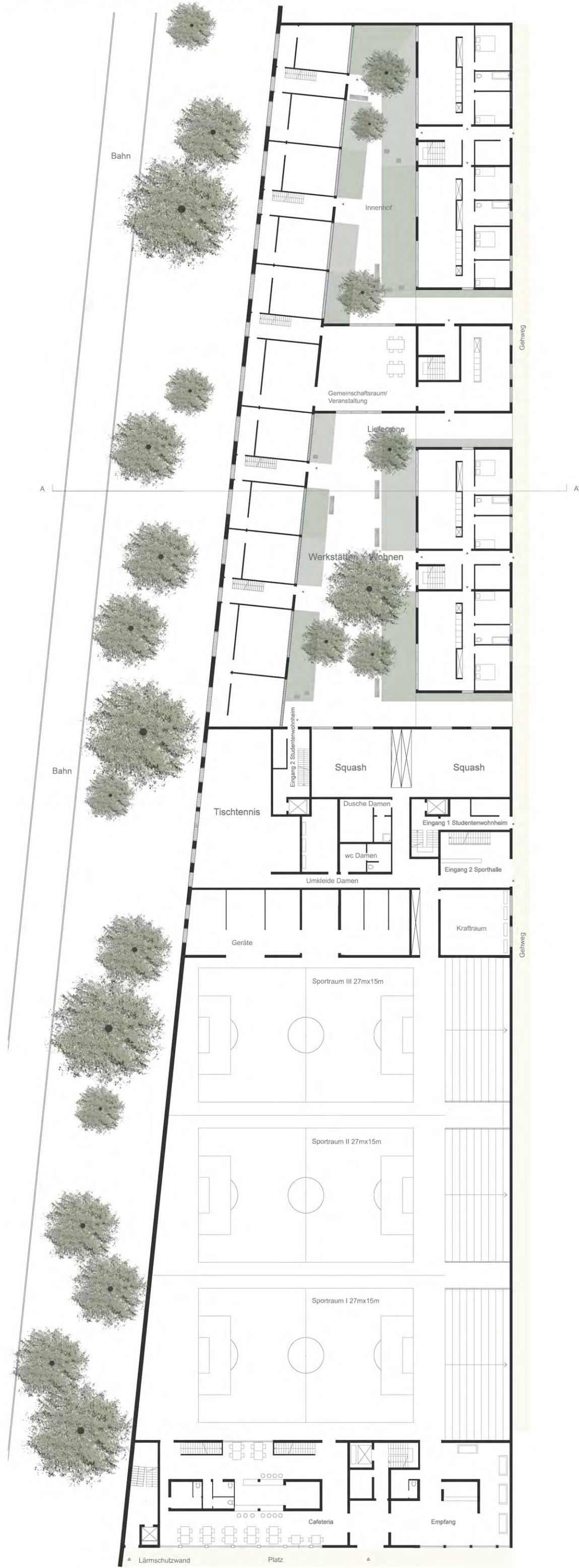
Grundriss EG M 1:200